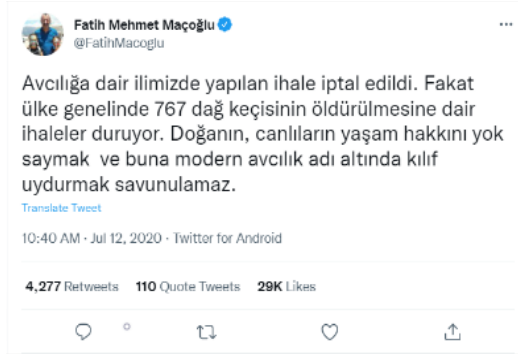
Görsel 7: Tunceli Belediye Başkanı Fatih Mehmet Maçoğlu'nun 12 Temmuz'da Twitter hesabında yaptığı son paylaşım (@FatihMacoğlu 2020)

Tunceli Valiliği'nin bu kararı üzerine Fatih Mehmet Maçoğlu'nun o süreçteki bu son paylaşımı da dikkat çekicidir (Görsel 7). Paylaşımından, Maçoğlu'nun söylem alanının evrenini genişletmeye çalıştığı anlaşılmaktadır. Aynı zamanda bu karşıt halkla ilişkiler çabasının sadece yerel kamunun inançsal değerlerine içkin olmadığı, daha büyük bir kamusal alanın değerlerine de seslenmeye çalıştığı açığa çıkmaktadır. Laclau bu durumu, tikellik ve evrensellik arasındaki ilişki olarak açıklamaktadır (2009, 332-333). Bu ilişkiye göre tikel, her ne kadar bir iç işleyiş mantığına sahip olsa da kendini de kapsayan bir eklemleme mantığına tabidir. Bu durumda dağ keçilerinin öldürülmesine dair inanç merkezli kamusal talebin tikel bir talep olduğu söylenebilir. Bununla birlikte bu tikel talebin, sistem karşıtı bir eklemleme mantığıyla birlikte evrensellik boyutu da vardır. Bu durumda, inanç birliği olmasa da Dersim halkı ile diğer toplumsal gruplar arasında, "avcılık karşıtlığı ve doğa savunusu" üzerinden daha büyük bir eşdeğerlik zinciri açığa çıkmıştır; tikel, evrensele dönüşmüştür. Böylelikle, eşdeğerlik zincirinin büyümesi kapsayıcı bir söyleme, yeni bir "boş gösterene" alan açmıştır. Çünkü yerelin, yani tikelin söylemi (Hızır'ın davarı, Düzgün Baba'nın keçisi vb.), evrenseli karşılayamaz olmuştur. Maçoğlu'nun son paylaşımındaki "doğanın ve canlıların yaşam hakkı" söylemi de tam olarak bu evrenselleşmeye dönük boş göstereni işaret eden hegemonik bir hamle olarak okunabilir.