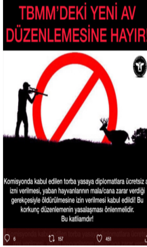
Görsel 3: Fatih Mehmet Maçoğlu'nun konuyla ilgili resmi Twitter hesabında 4 Temmuz 2020'de yaptığı ilk paylaşımın Dersim Dernekleri Federasyonu hesabındaki görseli (@Dersim_DEDEF 2020)

Laclau'nun değerler ve taleplerin politika kurucu potansiyeline yaptığı vurguyu tekrar hatırlayarak bu paylaşımındaki söylemin hayvan hakları savunucularına hitap ettiğini söylemek mümkündür (2003, 95-100). Dağ keçileri her ne kadar Dersim halkı için kutsal bir anlama sahip olsa da belediye başkanı daha büyük bir kamuya hitap edecek şekilde kurgulanan bir söylemi tekrar paylaşmıştır. Bu paylaşımında, Dersim halkının bu hayvanların yaşamasına dönük inanç temelli taleplerinin yerine, ülkenin diğer bölgelerinde yaşayan insanların da hayvan hakları bağlamı değerleri politize edilmeye çalışılmıştır. Yine Ernesto Laclau takip edilerek, "hayvan hakları yasası hemen" söylemi, çatı söylem, yani örgüt ve diğer toplumsal gruplar arasında özdeşlik kurma işlevi gören "boş gösteren" olarak nitelendirilebilir.