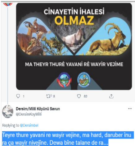
Görsel 6: Tunceli Belediyesi Twitter hesabında 11 Temmuz 2020'de yapılan ikinci paylaşım (@Dersimbel 2020)

Castells'in "ağ toplumu" kavramsallaştırmasını tekrar hatırlamakta fayda vardır. Castells (2016: 54-71) "ağ"ı, birbirine bağlanmış düğümler uzantısı olarak kavramaktadır. Her düğüm başka bir kolektif karaktere sahip olabilmekte ve her düğümün ağla ilişki düzeyi de değişebilmektedir. Bununla birlikte, her düğümü uzantının içinde tutan "merkez" bağ noktaları vardır. İletişim ise ağların sürekliliğini sağlamaktadır. Ağ içerisindeki düğümler, uzlaşma ve çatışma dönüşümlerine göre kopabilmekte ya da ağa yeni düğümler eklenebilmektedir. Bu şekilde, ulusallaşan ya da küreselleşen ağ toplumu içinde "yerel benlikler" ve "ayrık, azınlık kültürel kimlikler" hem çoğulluğu hem de karşıtlığı ağa direniş olarak yansıtmaktadır. Nihayetinde hem Tunceli Belediyesi Twitter hesabında hem de Belediye Başkanı Fatih Mehmet Maçoğlu'nun hesabında ağ toplumuna dönük söylemlerin "merkez düğüm" noktalarından birini de kültürel kimliğe dair unsurların kurduğunu söylemek mümkündür. Yine bu bağlamda belediyenin aynı tarih içinde yaptığı (11 Temmuz 2020) bir başka paylaşım ve paylaşımına gelen yanıtlar dikkat çekicidir.