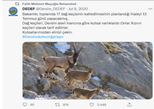
Görsel 5: Tunceli Belediye Başkanı Fatih Mehmet Maçoğlu'nun 9 Temmuz 2020'de Dersim Dernekleri Federasyonu Twitter hesabından yaptığı paylaşım (@Dersim_DEDEF 2020)

sorumluluğunun da devlete ait olduğu ve talebi karşılamayan merkezi idare ile yerel kamu arasında antagonizma kurulduğu görülmektedir. Daha önce de belirtildiği üzere Laclau (2013, 102-111), bu durumu kamu ve örgüt arasındaki özdeşliği güçlendiren antagonistik siyaset olarak açıklamıştır.