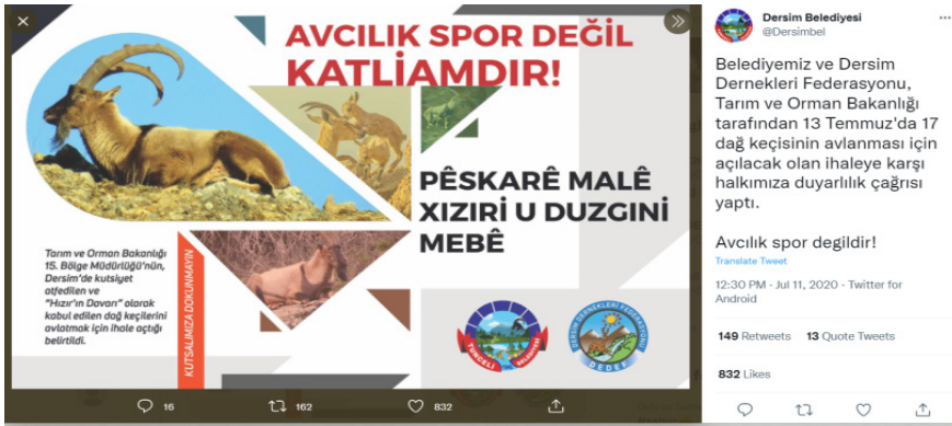
Görsel 4: Tunceli Belediyesi'nin 11 Temmuz 2020'de yaptığı, av ihalesiyle ilgili paylaşımı (@Dersimbel 2020)

alanını inşa etmektedir ve iki yönlü simetrik iletişim böylelikle etkin bir şekilde işlemektedir. Gelenen noktada, bu söylem aracılığıyla, bu tarz avların yasal olarak konumlandırılması skandal bir olay olarak ülke gündemine taşınmış ve ağ toplumunun dikkati çekilmeye çalışılmıştır. Bu bağlamda, Maçoğlu'nun sosyal medya aracılığıyla, belediyenin dağ keçileri bağlamındaki halkla ilişkiler çabalarına aktivist bir nitelik kazandırmaya çalıştığı da söylenebilir. Robert Wakefield, internetin küresel bir güç haline dönüşmesiyle birlikte aktivizm içeren halkla ilişkiler çabalarının daha da yaygınlaştığını vurgulamaktadır (2009, 106-107). Yerel, ulusal ve uluslararası kamuya çok hızlı bir şekilde ulaşabilen içerikler, artık devletlerin otoriter politikaları karşısında karşıt kamular inşa etmeyi başarmaktadır. Maçoğlu da sosyal medya aracılığıyla bir yandan belediyenin kamusunun (Dersim'de yaşayanların) taleplerini ve değerlerini örgüt olarak gözettiğini açığa çıkarmıştır, diğer yandan da ulusal ve uluslararası kamuya dönük aktivist bir halkla ilişkiler çabası yürütmüştür.